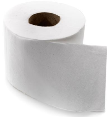
6 SECAR LAS MANOS