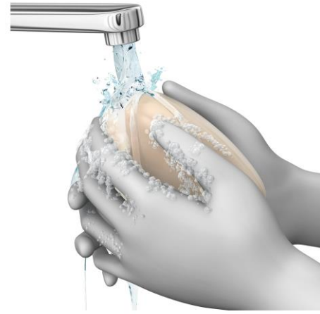
3 FROTAR BIEN LAS MANOS