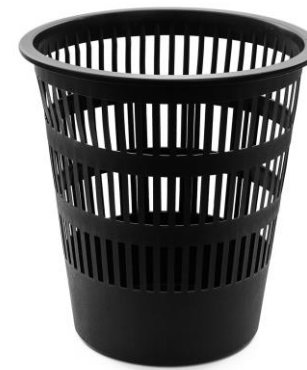
6 TIRAR EL PAPEL A LA PAPELERA