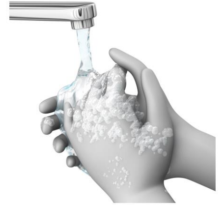
4 ACLARAR EL JABÓN